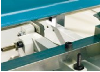
El ektromechanical double sheet detector