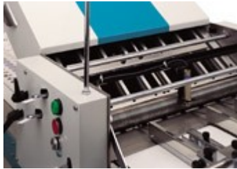
C ombination fold rollers and caliper gap set