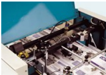
vacuum drum and electronic pile height sensor