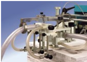
heat separation system