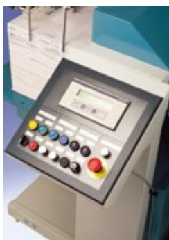
Operator control panel